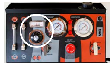
Corredo standard / Standard outfits